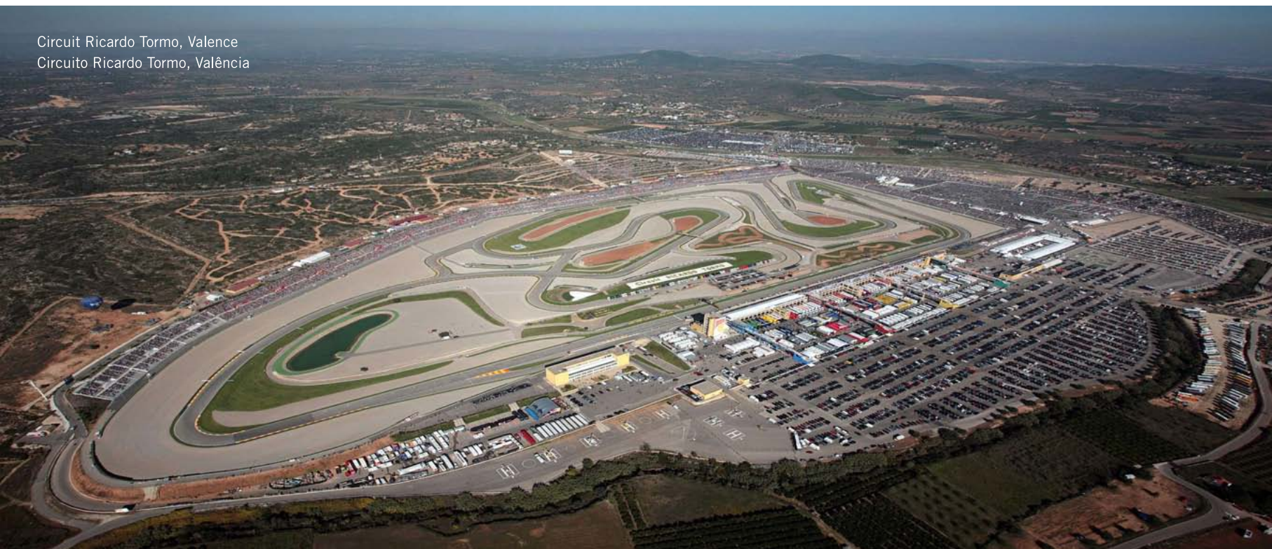
Circuit Ricardo Tormo, Valence Circuito Ricardo Tormo, València

Depuis sa création, Grupo Cementos La Unión a participé à de grands projets et travaux emblématiques. La haute qualité des produits et son implication dans les projets lui ont permis de collaborer à toutes les étapes de la construction.