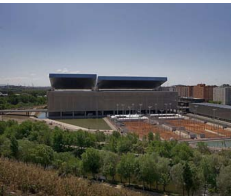
Caja Mágica, Madrid Caja Mágica, Madrid

A confiança demonstrada por construtores, promotores, arquitectos ou engenheiros tem sido determinante para que as referências em construções de nível superior aumentem proporcionalmente ao desenvolvimento da companhia.