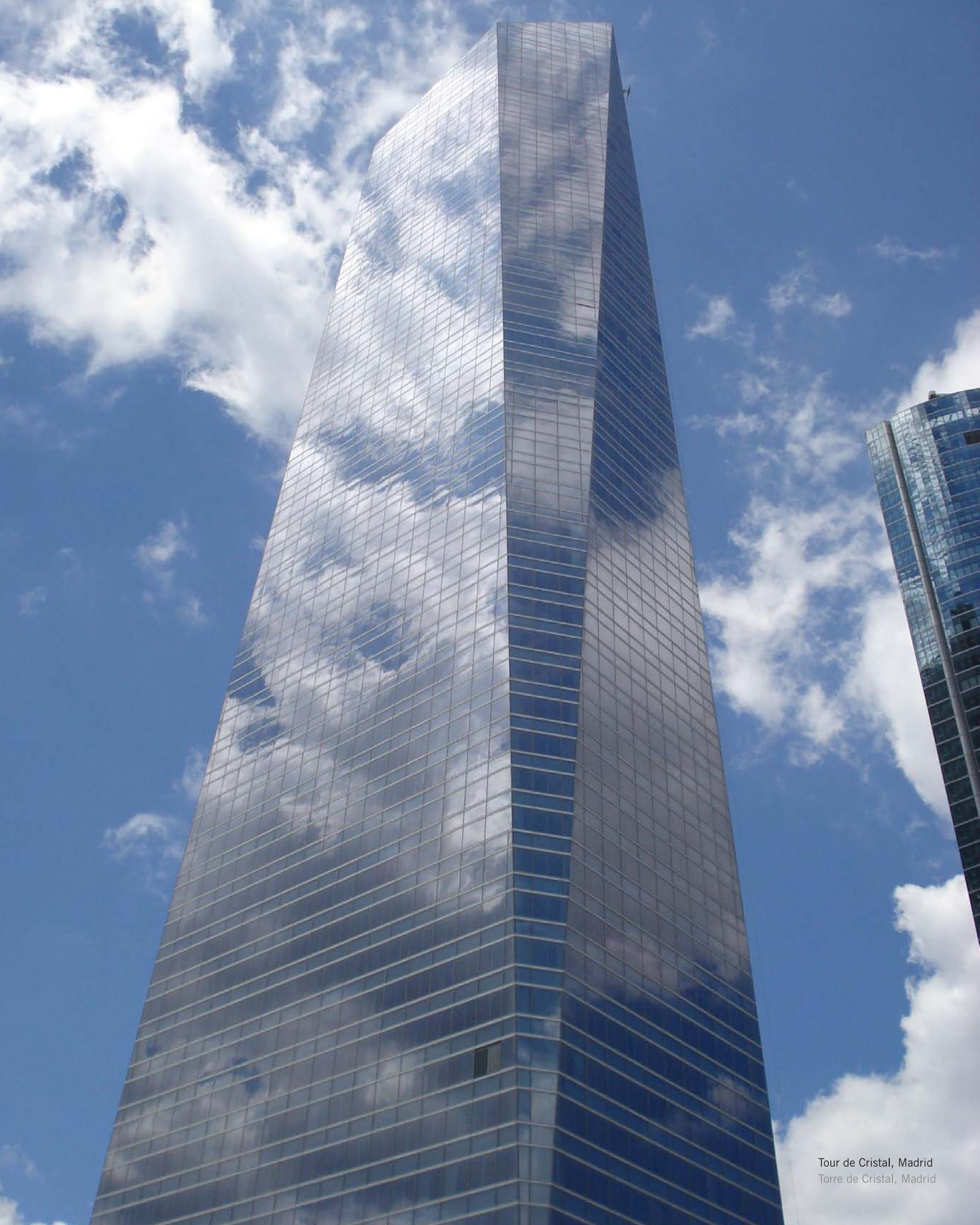
Tour de Cristal, Madrid Torre de Cristal, Madrid