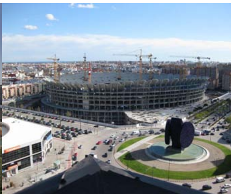
Stade Valencia C.F., Valence Estádio do Valencia C.F., València