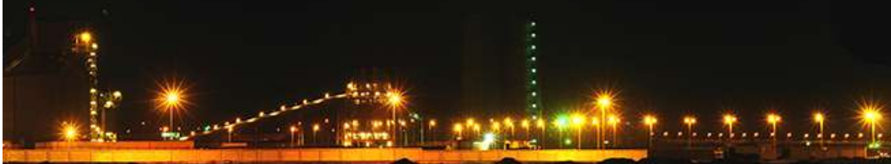
Égypte. Arabian Cement Company. Usine de traitement. Egipto. Arabian Cement Company. Instalação de processamento.