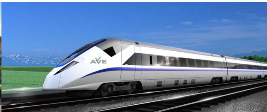
Tronçon de voie ferrée à grande vitesse, Espagne Troços de linha ferroviária de alta velocidade, Espanha